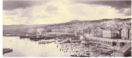
Version 5 – 21 avr. 2017 Alger vers 1920